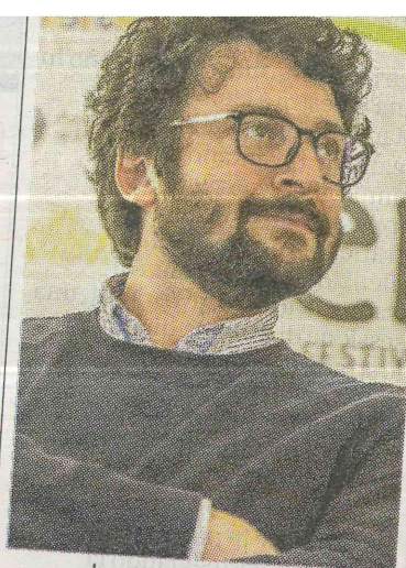
Lo scrittore Alessandro Leogrande, scomparso nel 2007. In alto, la pièce Katër i Radës. Il naufragio

libero, senza frontiere, perché racconta il noi e recupera la storia dell'io stracciato dall'egoismo delle frontiere» scrive Luigi Mangia per presentare un progetto targato Koreja, che arriva con la stessa forza inquieta e carica di promesse dei sommovimenti d'acqua. Torna, pertanto, dal 14 luglio al 14 settembre, il teatro dei luoghi Fest e Fineterra, con la dedica - necessaria, dovuta, a colui che del confine, della distanza, delle differenze, ha fatto lettura e scrittura: Alessandro Leogrande, «un uomo che sapeva da che parte stare». Il festival si mette proprio dalla sua parte con un lavoro imponente: in quattordici giorni, undici compagnie, una co-produzione,